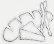
Antipasti (p.4 e 5)